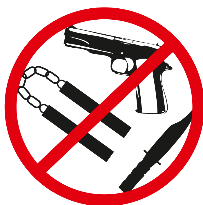
Waffen, gefährliche Gegenstände weapons, dangerous objects