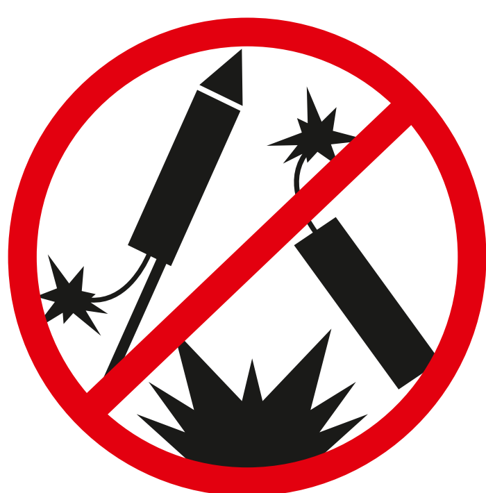
Pyrotechnische Gegenstände pyrotechnical devices