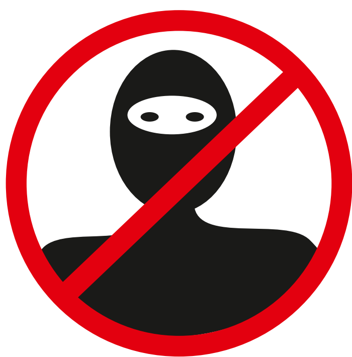
Gegenstände, die die Identifizierung verhindern können items that can prevent the identification