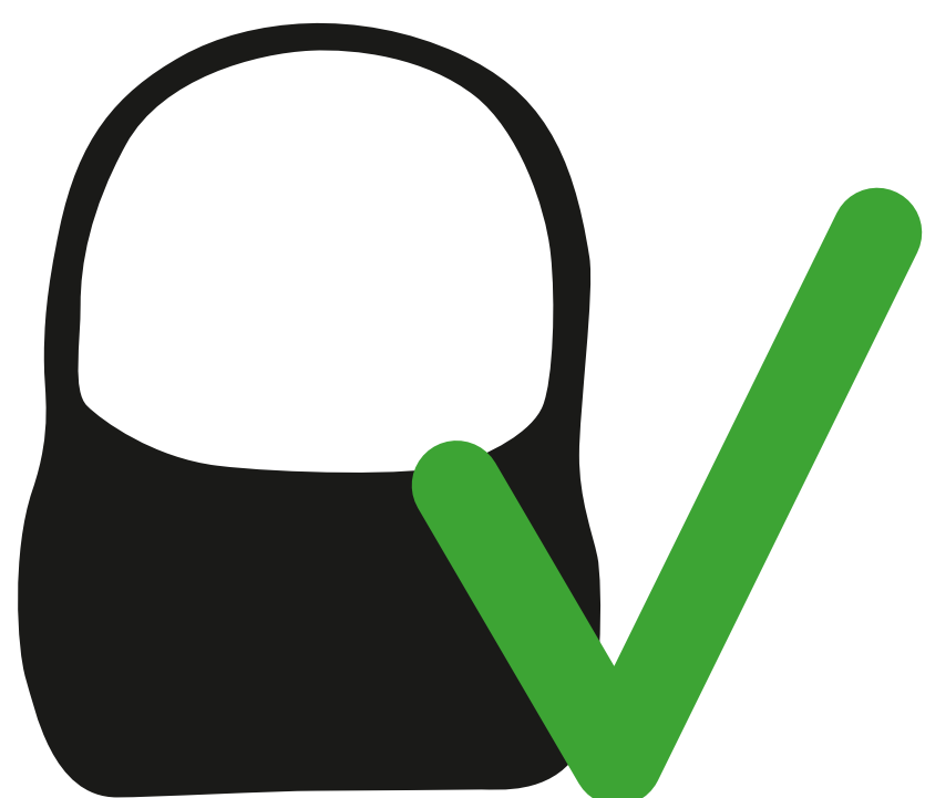
Kleine Handtaschen (bis DIN A4) small handbags (up to DIN A4)