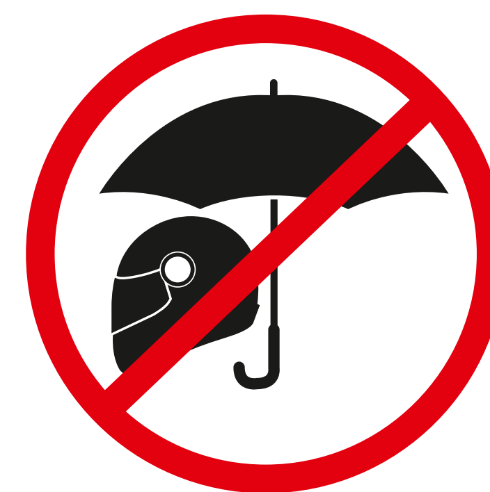
Stockregenschirme, Helme stock umbrellas, helmets