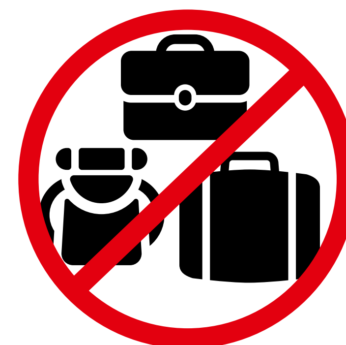
Rucksäcke, große Taschen, Koffer backpacks, large bags, suitcases