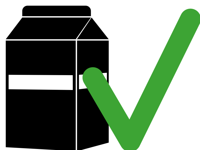
Tetra Pak bis 0,25l Tetra Pak up to 0,25l