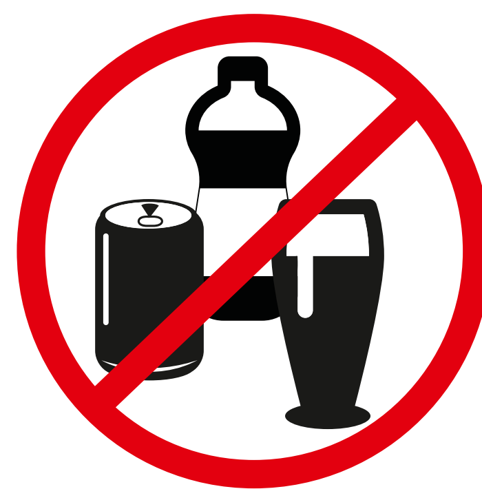
Glas- u. Plastikflaschen, Dosen, Tetra Pak > 0,25l, alkoholische Getränke glas and plastic bottles, cans, Tetra Pak > 0,25l, alcoholic drinks