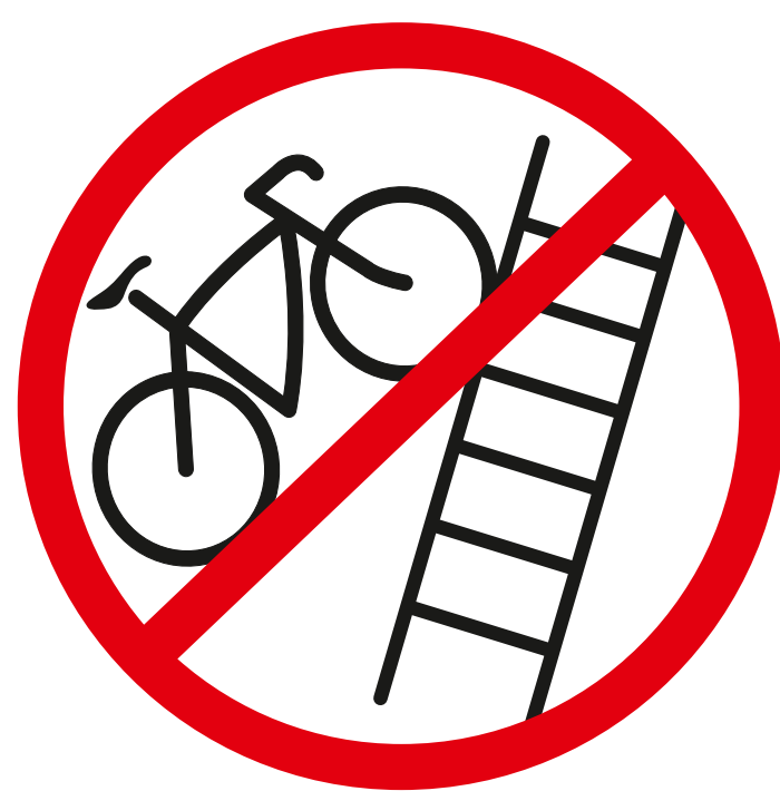
Sperrige Gegenstände bulky objects