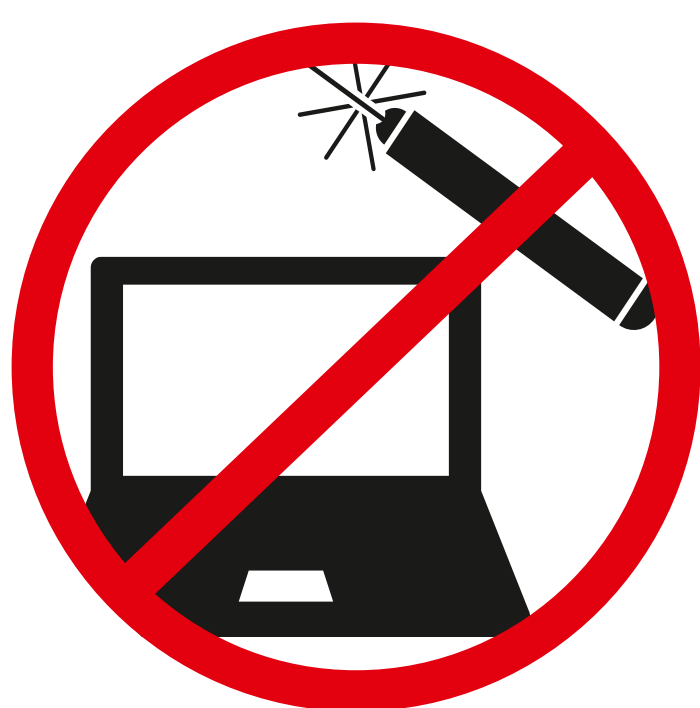
Laserpointer, Akkupacks, sonstige elektronische Gegenstände laser pointer, battery packs, other electronical items