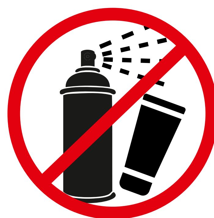
Gassprühdosens, Deo, Parfüm, Haarspray, Kosmetikprodukte gas spray can, deodorant, perfume, hairspray, cosmetic products