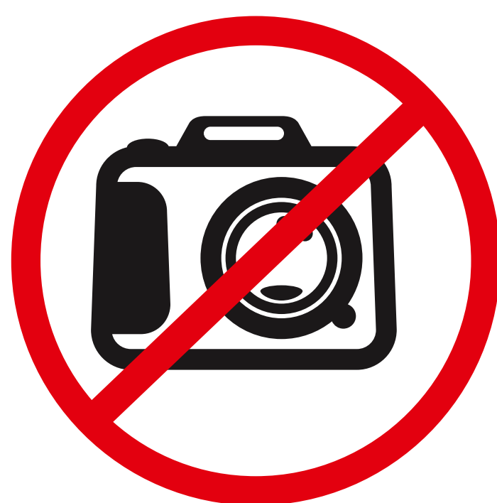
Professionelle Fotokameras mit Wechselobjektiv über 200mm Brennweite professional photo cameras with interchangeable lens higher than 200mm focal length