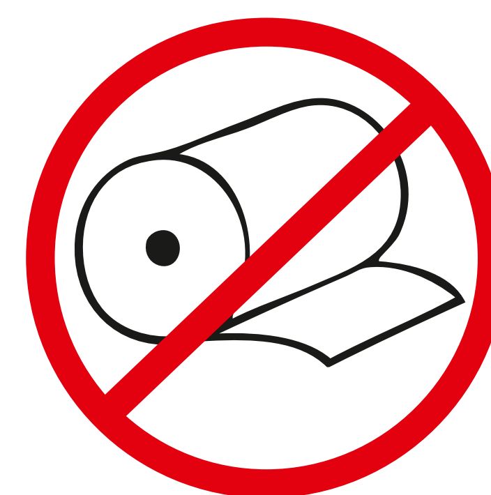
Brandlast erhöhende Materialien fire load enhancing material