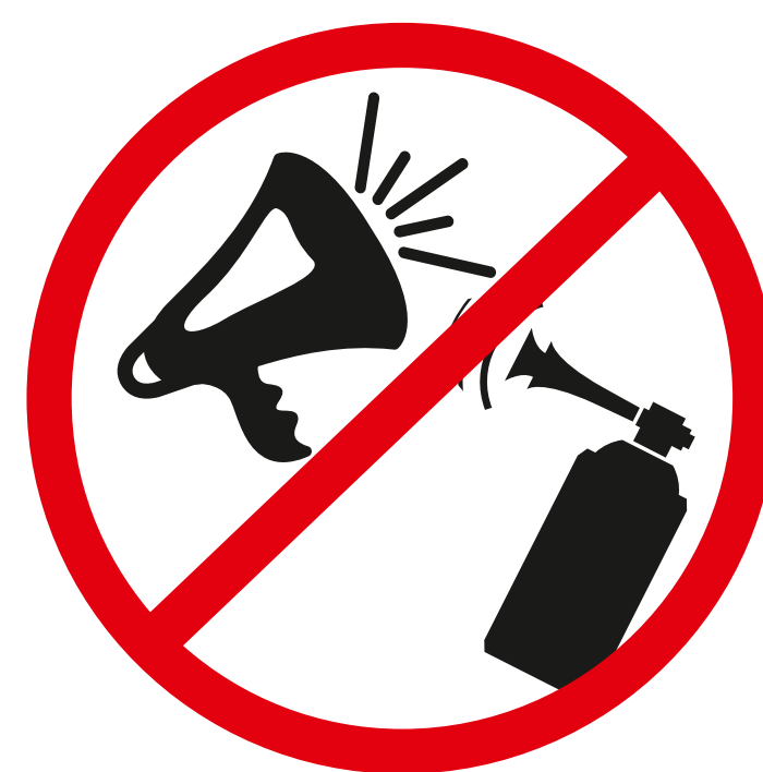
Mechanisch u. elektrisch betriebene Lärminstrumente, Vuvuzelas mechanical and electrical noise making devices, vuvuzelas