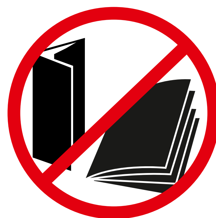
Werbende und kommerzielle Gegenstände, Flyer, Aufkleber promotional and commercial objects, flyer, sticker