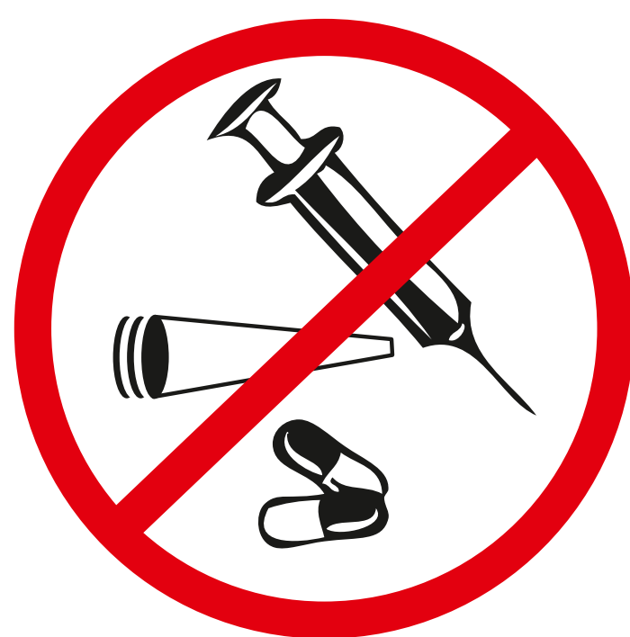
Drogen jeglicher Art drugs of any kind